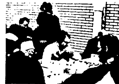
Guy à la recherche d'une faille. Guy zoekt de zwakte...